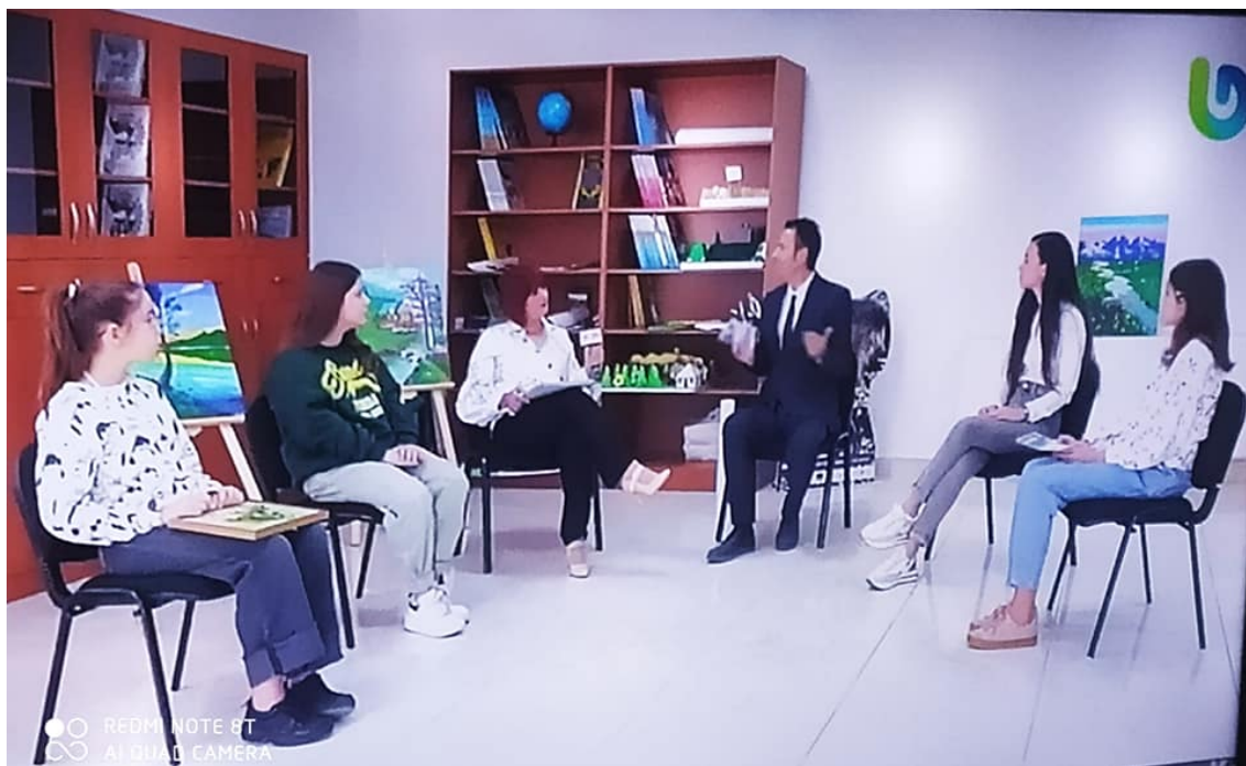
Shkolla "Zihni Toska" - Berat në Studio Plus në kuadër të Projektit ACAP