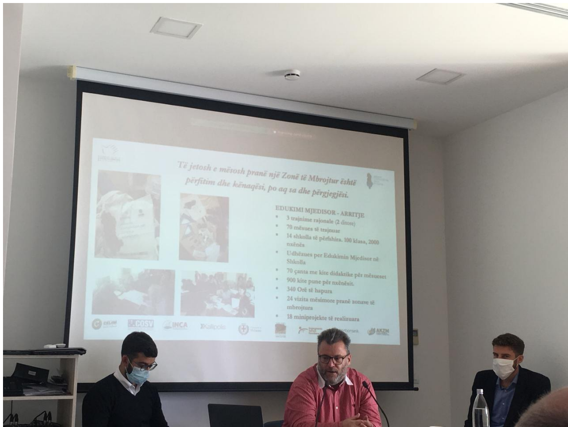
Aksioni Komunitar për Zonat e Mbrojtura