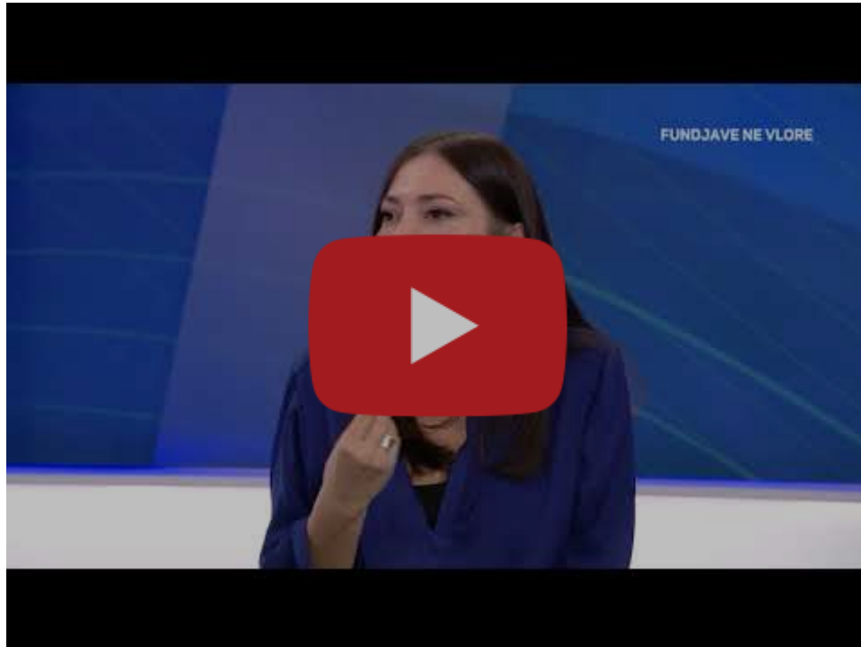
Vlora - destinacioni i fundjavës