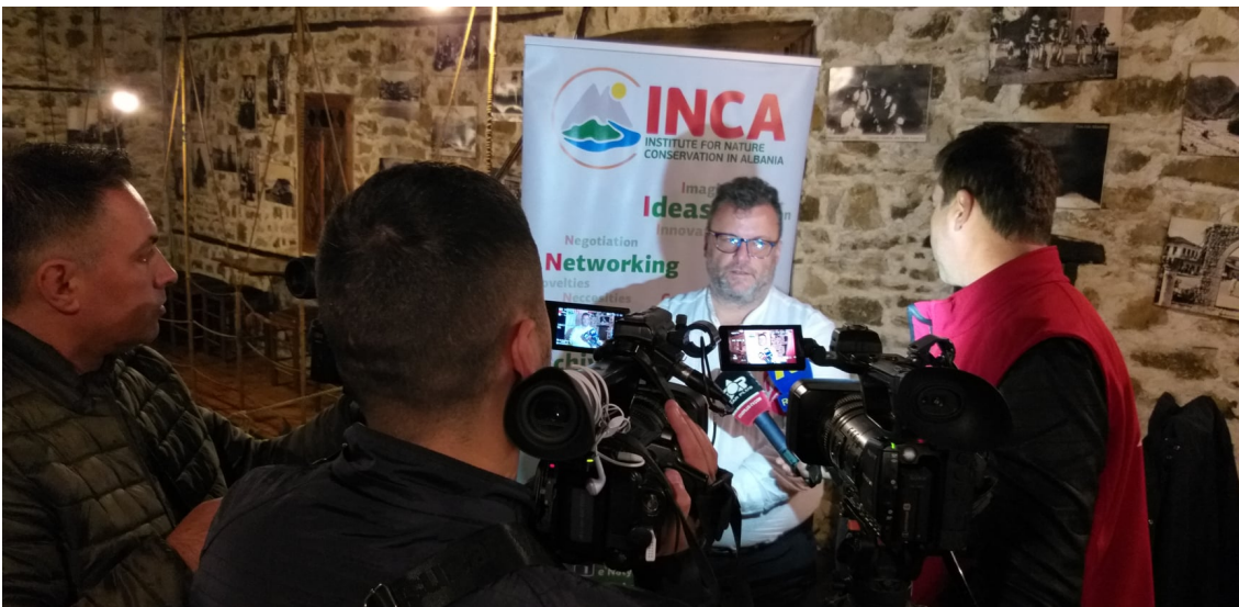
Mbrojtja e Lumit Buna