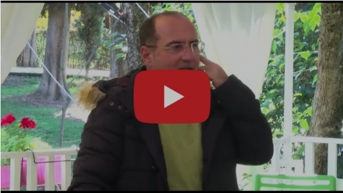
Nis zbatimi i projektit për ruajtjen e burimeve natyrore lokale