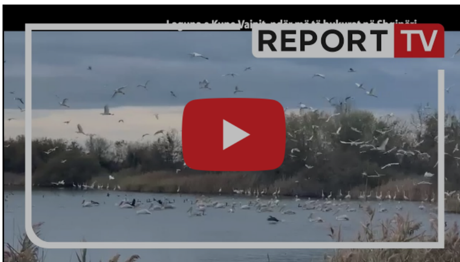
Laguna e Kune Vainit një vlerë turistike