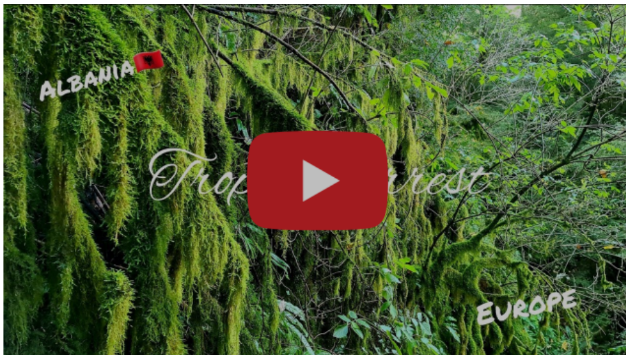
Pyll "tropikal" relaksues brenda Evropës / Shqipëri. Parku Kombëtar i Llogarasë