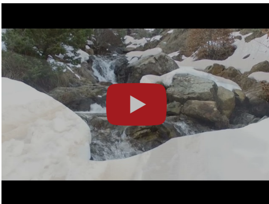
Shkalla e Skënderbeut