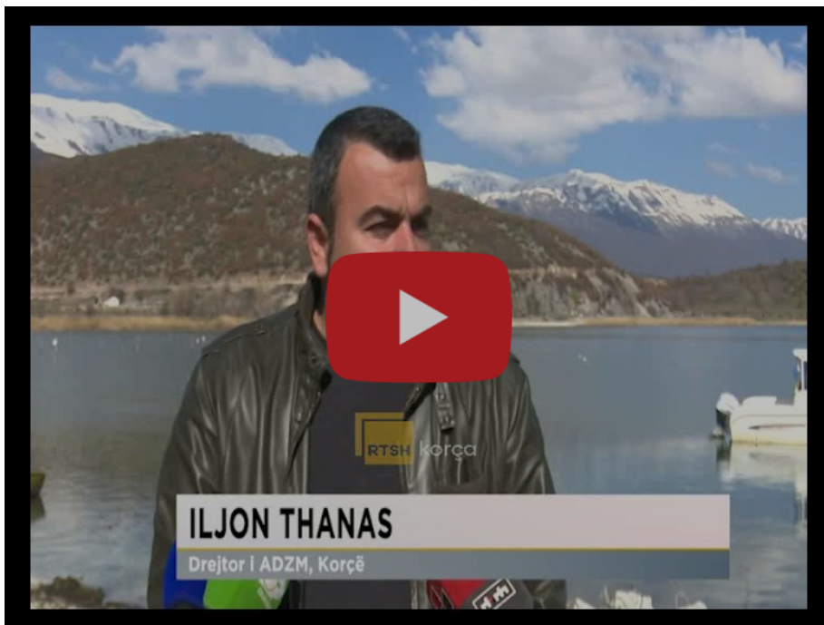
Vendosen bova sinjalizuese në liqenin e Prespës