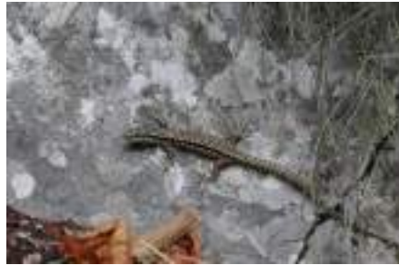
Bollae shtëpisë ( Elaphe longissima )