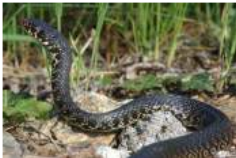
Bolla mekatër vija ( Elaphe quatrolineata )