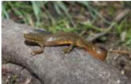
Tritoni me kreshtë ( Triturus cristatus )