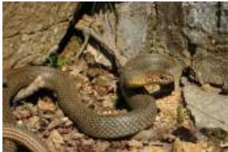
Bolla mekatër vija ( Elaphe quatrolineata )