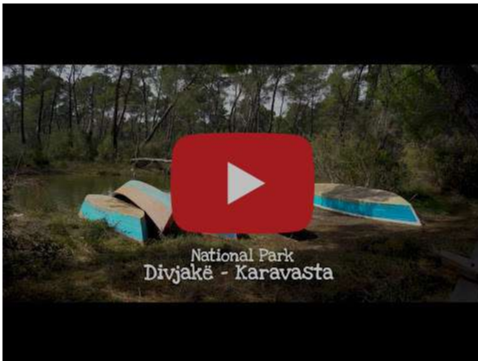
National Park Divjakë - Karavasta