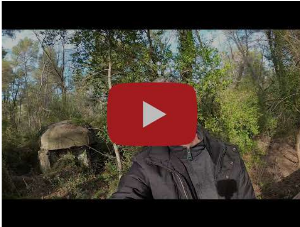
All'interno del Parco Nazionale di Divjakë Karavasta in Albania (Tour Virtuale)