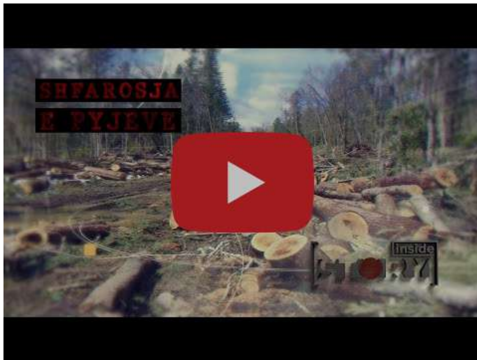
"Shfarosja e Pyjeve" - Masakra nga zjarret dhe prerjet e paligjshme