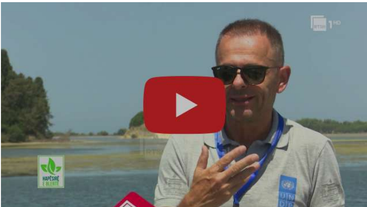
Zona e Mbrojtur në Vlorë