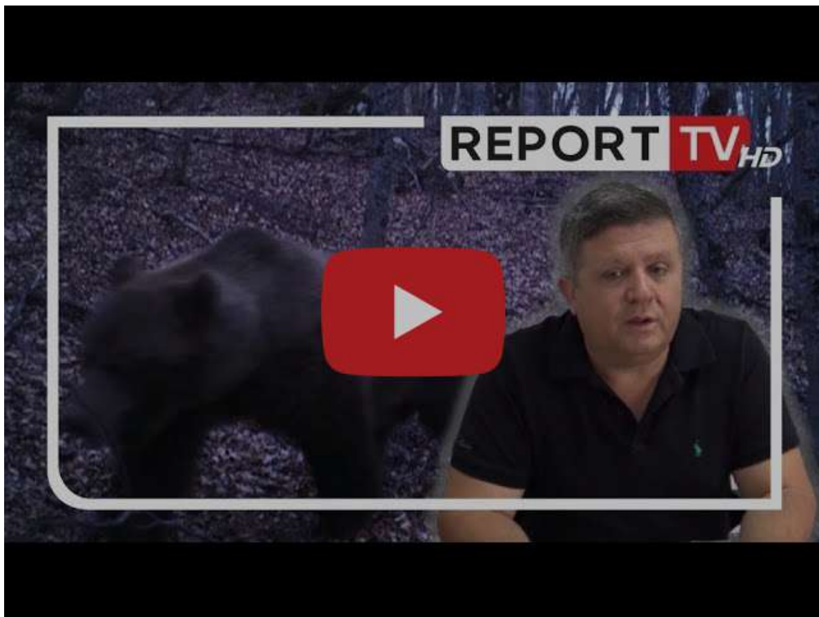
Mali i Tomorrit, shtëpia e shumë kafshëve të egra