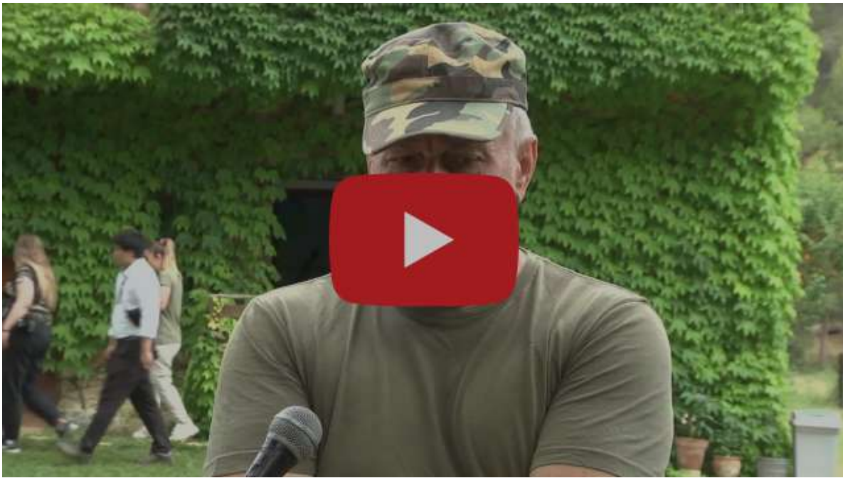
Parku Kombëtar Divjakë - Karavasta, një perlë e natyrës