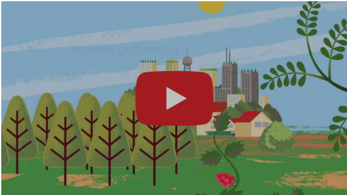
Nature based solutions for the climate in the Western Balkans