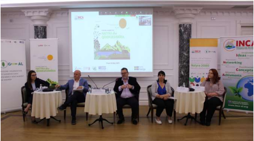
Forum Kombëtar - Natyra dhe Qëndrueshmëria

Nr.120 - Maj 2023 / viti i njëmbëdhjetë i publikimit