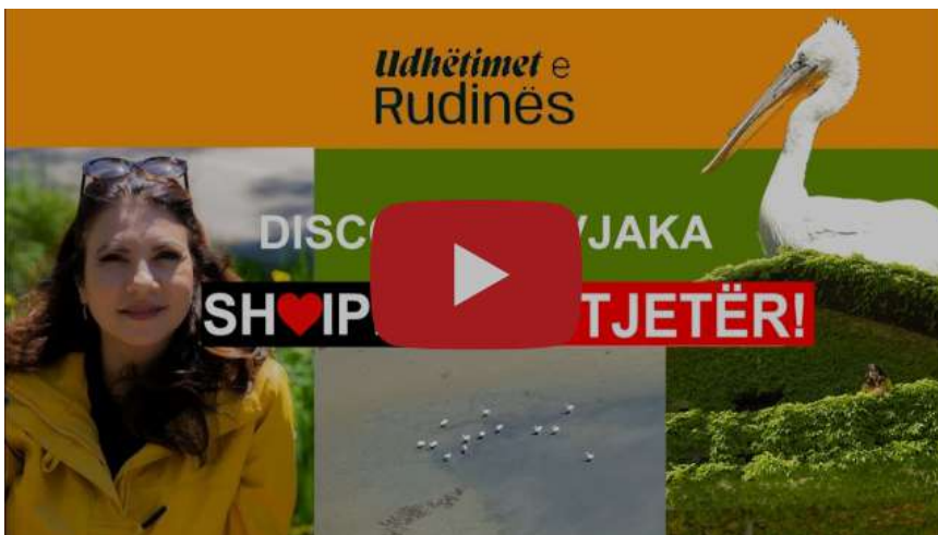
Zbulo Divjakën këtë verë! Shqipëri, ku tjetër!