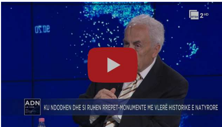
Zgjedhjet dhe kujdesi ndaj Monumenteve të Natyrës në Zonat e Mbrojtura