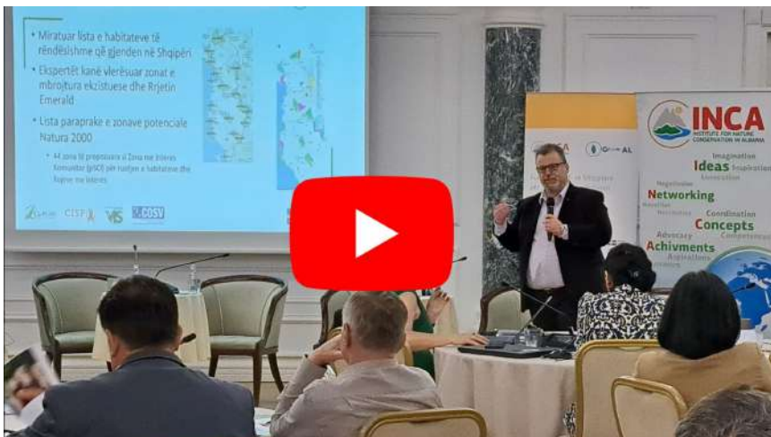
Live Forumi Kombëtar "Natyra dhe Qëndrueshmëria"