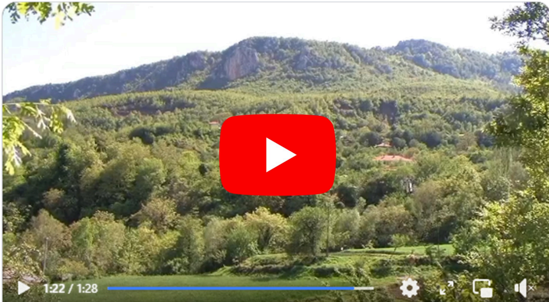
Dardhë - Librazhd, aty ku mrekullitë janë të pa fund