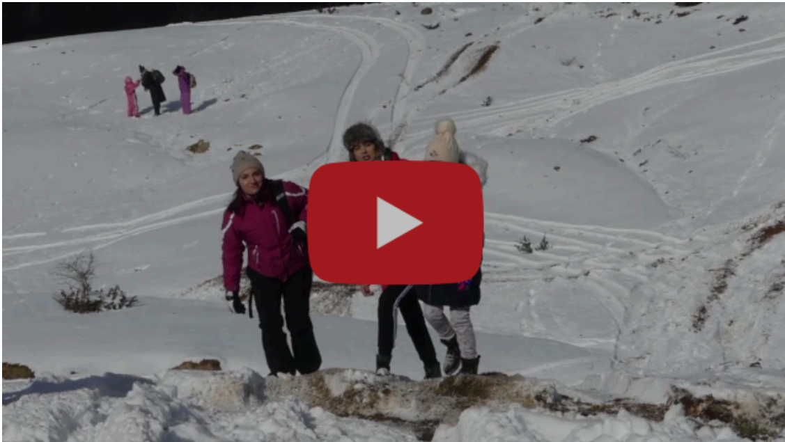
Shebeniku dhe mrekullitë