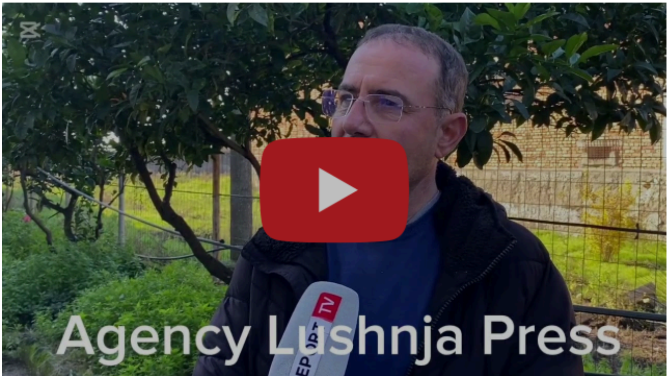
Katastrofë mjedisore nga mbetjet që sjell lumi Shkumbin. Mbetjet përgjatë rrjedhës përfundojnë në det.