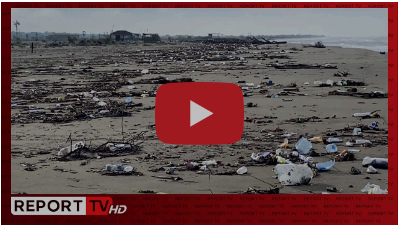
Katastrofë mjedisore në Divjakë dhe Vilëbashtovë! Plazhet mbushen me mbetjet që shkarkoi lumi