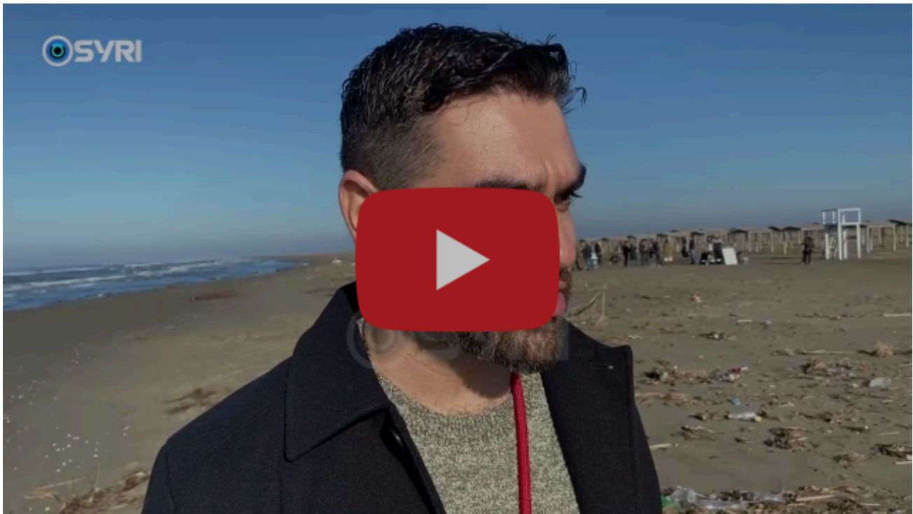
Plazhet e Divjakës kthehen në landfill