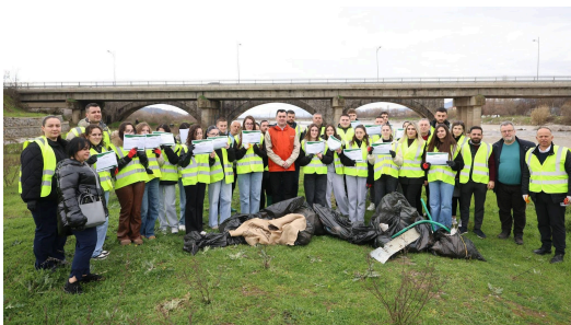
Të rinjtë për monitorimin shkencor të mjedisit përgjatë Lumit Shkumbin