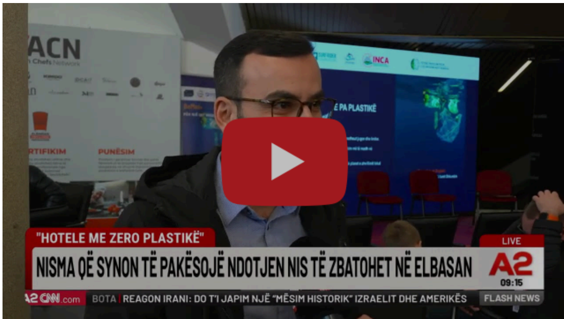
"Hotele me zero plastikë", nisma që synon të pakësojë ndotjen, nis të zbatohet në Elbasan