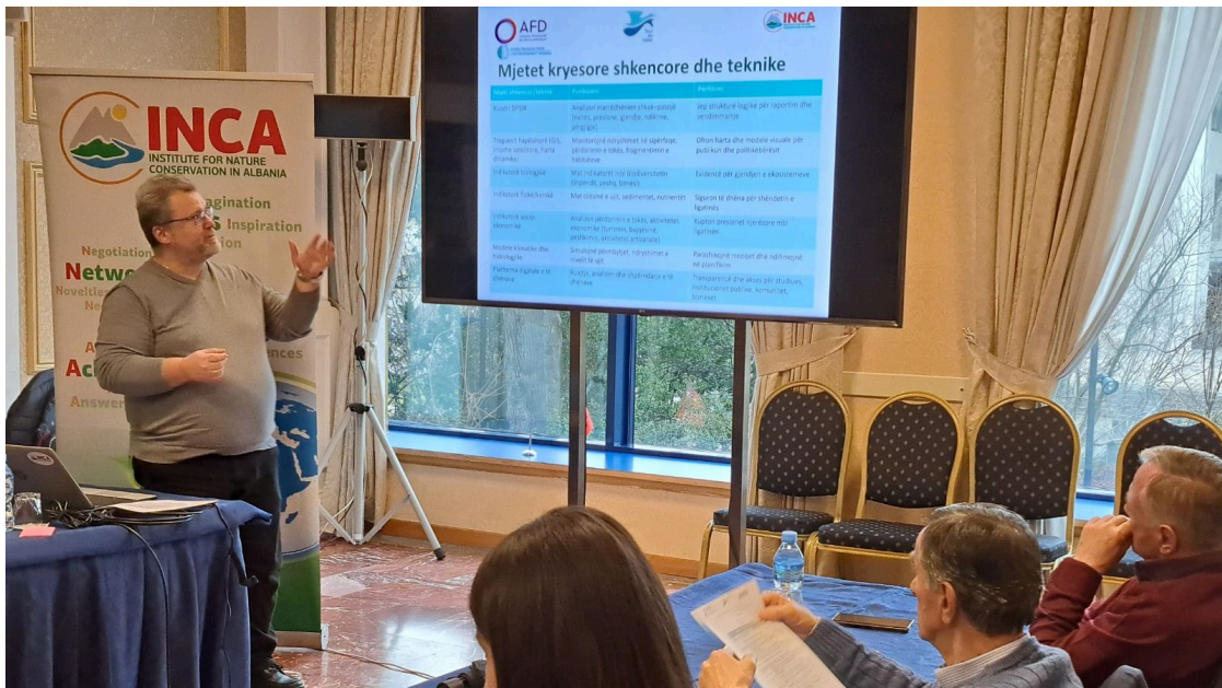
Krijimi i observatorit të ligatinave

Nr.153 - Shkurt 2026 / viti i katërbëdhjetë i publikimit