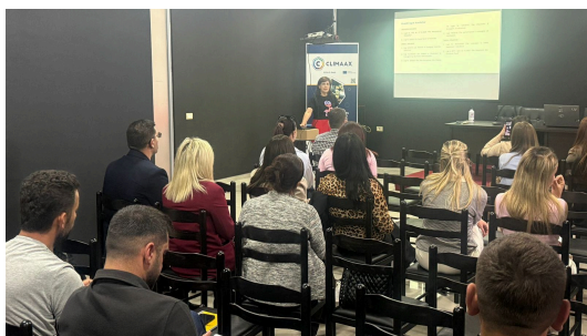
Takim konsultues për Planin e Përshtatjes ndaj Ndryshimeve Klimatike në Belsh