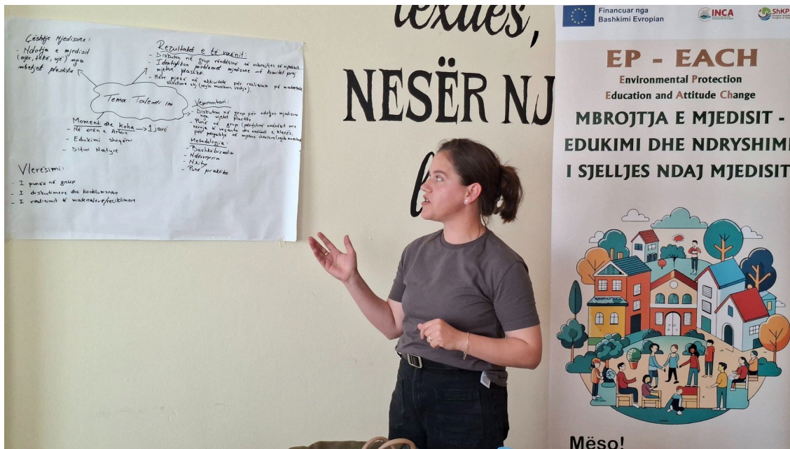
Një hap më afër Edukimit Mjedisor të Qëndrueshëm

Nr.156 - Maj 2026 / viti i katërbëdhjetë i publikimit