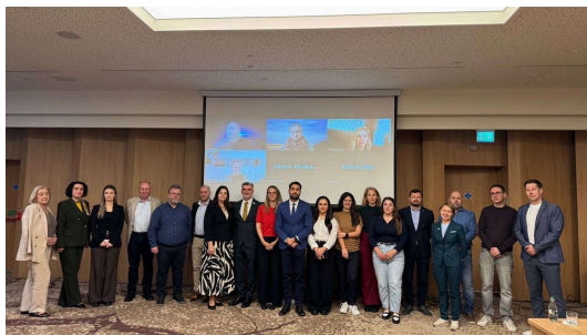
Bashkëpunim për natyrën në Ballkanin Perëndimor