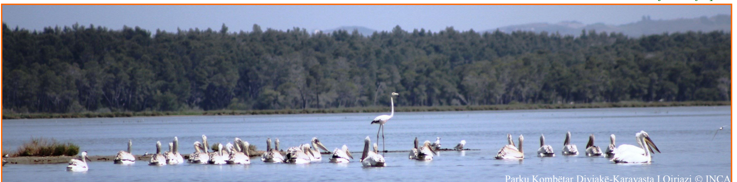
Parku Kombëtar Divjakë-Karavasta I.Qirjazi © INCA

Me Ligjin nr.9868, datë 04.02.2008 “Për disa shtesa dhe ndryshime në ligjin nr. 8906, datë 06.06.2002 “Për zonat e mbrojtura”, Vijon në faqe 2