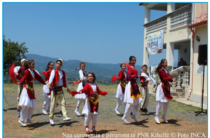
Nga ceremonia e përirimit të PNR Kthellë

Në menaxhimin e ZM duhet shtuar më shumë ndërgjegjësimi lidhur me konceptin e qëndrueshmërisë, njohjes dhe mirëmbajtjes së tyre. Brenda ZM mungojnë qendrat e informacionit dhe informacioni mbi biodiversitetin për publikun. Vlerat e biodiversitetit janë të përshkruara në dokumentet të cilat përgatitjen për propozimin e ZM a në planet e menaxhimit, por që nuk janë të dukshme për publikun dhe përdoruesit e burimeve natyrore. Shoqëria Civile është e rëndësishme, jo vetëm të japi kontribut në ruajtjen dhe menaxhimin e ZM, por edhe në interpretimin e saktë të informacionit mbi ZM tek grupet e interesit dhe turistët.