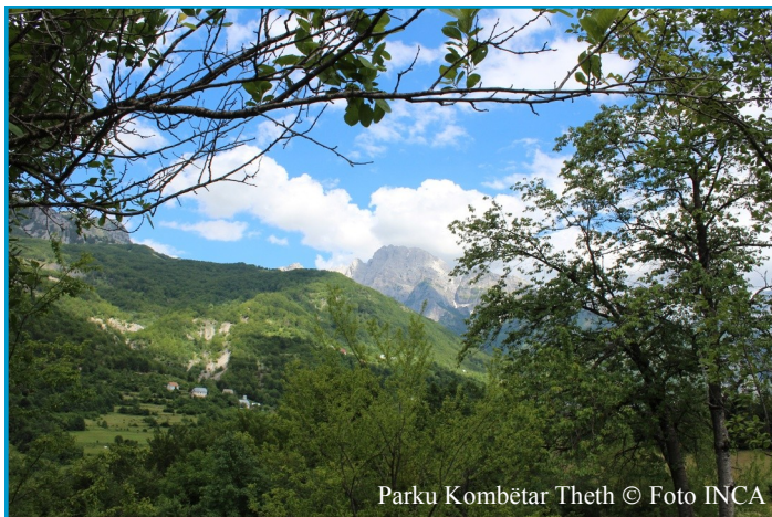
Parku Kombëtar Theth

ose 69.4%, kanë plane menaxhimi dhe 8 të tjera, me sipërfaqe 107 mijë ha ose 23.3 %, kanë plane menaxhimi në proces miratimi. Një kontribut të rëndësishëm në këtë drejtim ka dhënë INCA dhe RrMN si në rastin e hartimit të Planit të Menaxhimit për PKD “Karaburun-Sazan”, për ZM “Gjiri i Porto Palermos-Llamani”, në studimin, shpalljen dhe hartimin e planit të menaxhimit për Parqet Natyror Rajonal (PNR) të “Liqeni i Ulzës”, “Nikaj-Mërtur”, “Shkrel”, “Kthjellë”, “Zagori” etj.