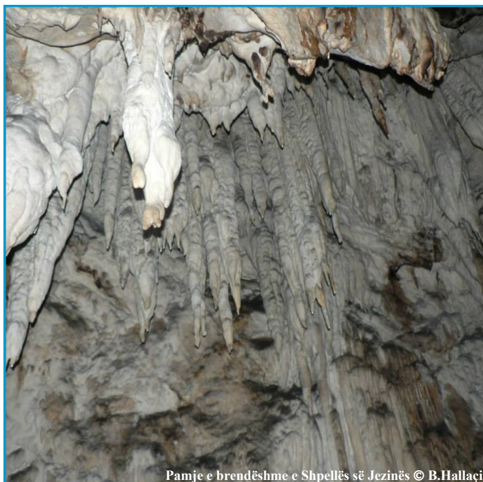
Pamje e brendëshme e Shpellës së Jezinës

...bazuar në dispozitat e ligjit nr. 8906, datë