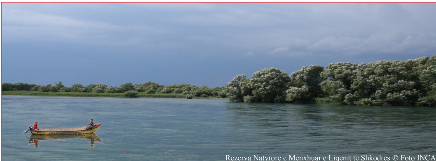
Rezerva Natyrore e Menxhuar e Liqenit të Shkodrës