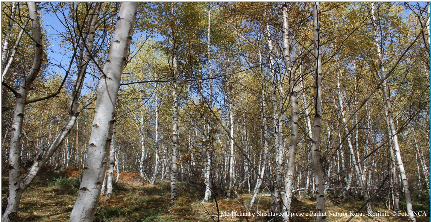
Mëshfteknat e Shishtaveçit pjesë e Parkut Natyror Korab-Korçënik