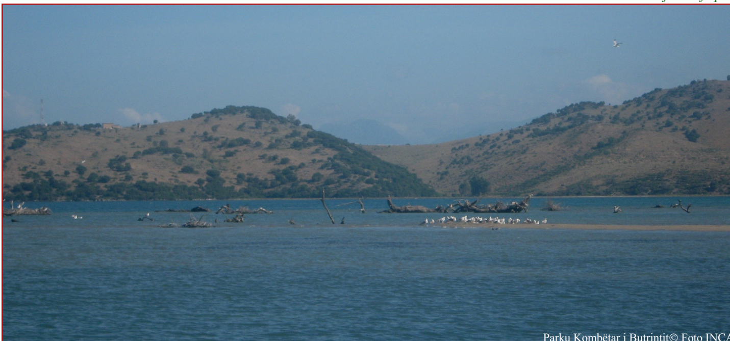
Parku Kombëtar i Butrintit

Organizatrat partnere të Rrjetit për Mbrojtjen e Natyrës