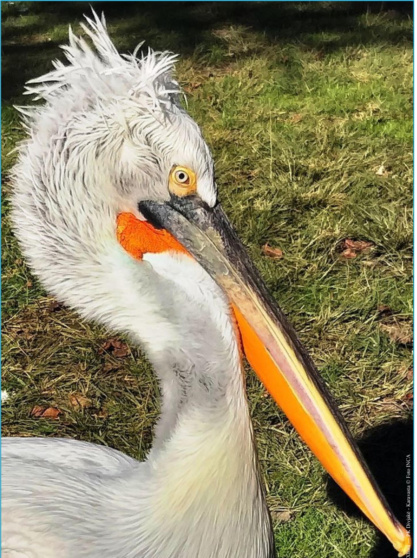
Xhoni — PK Divjake - Karavasta